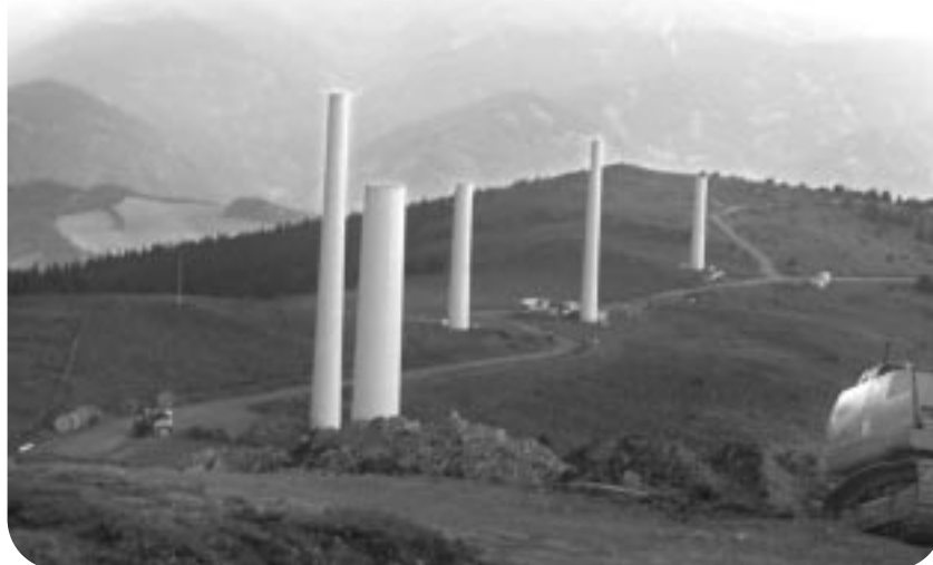
Blick auf die ersten Türme des Tauernwindparks.

Der Tauernwindpark liegt auf dem Gemeindegebiet von Oberzeiring in der Nähe der Klosterneuburger Hütte. Der Höhenrücken zwischen Kobaldeck und Pichlerstein verläuft quer zur vorherrschenden Hauptwindrichtung und ist wegen seiner exponierten Lage sehr gut für den Betrieb von Windkraftanlagen geeignet. Die durchgeführten Windmessungen haben eine mittlere Windgeschwindigkeit von 7 m/s ergeben, was etwa den Windverhältnissen an der Nordseeküste entspricht.