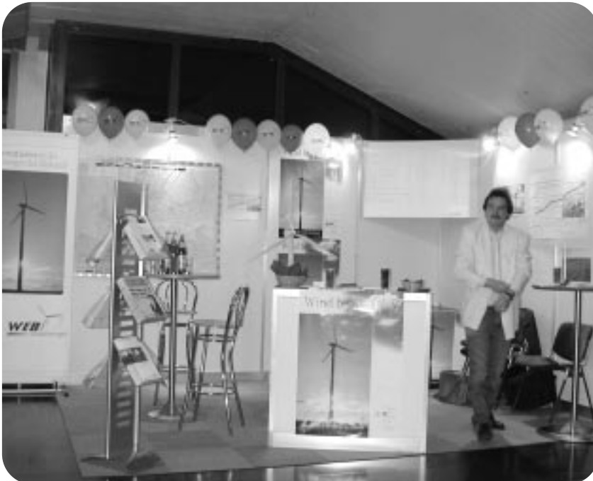
Der WEB-Messestand bei der „International Money Trend“ in Innsbruck.

Die im Zuge der fünften Kapitalerhöhung durchgeführten Veranstaltungen wurden sehr unterschiedlich angenommen. Bereits nach den ersten Stammtischen war klar, dass zusätzliche Werbung über das WEB – Umfeld hinaus notwendig war. Mit zahlreichen Postwurfsendungen und persönlichen Einladungen konnten zusätzliche Interessentinnen und Interessenten gewonnen werden.