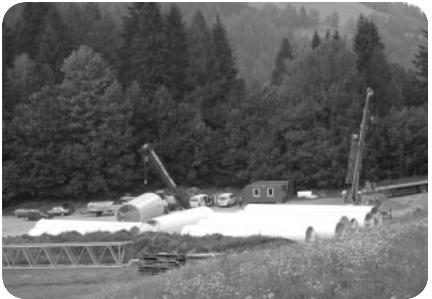
Der Logistikplatz, wo die angelieferten Anlagenteile für den Weitertransport auf den Berg zwischengelagert werden.

Am Standort des Tauernwindparks sind einerseits durch die Zuwegung zur nahe gelegenen Klosterneuburgerhütte und andererseits durch das direkt angrenzende Schigebiet Lachtal bereits Eingriffe in die Natur erfolgt, die Voraussetzung für die Erschließung des Gebietes für die Windkraftnutzung waren. Der Ausbau der Infrastruktur war daher nur ein kleiner Schritt im Zuge des Projektes. Auch beim Bau wird auf die Almböden besonders Rücksicht genommen, der Humus wird abgetragen, gelagert und wieder zur Rekultivierung eingesetzt.