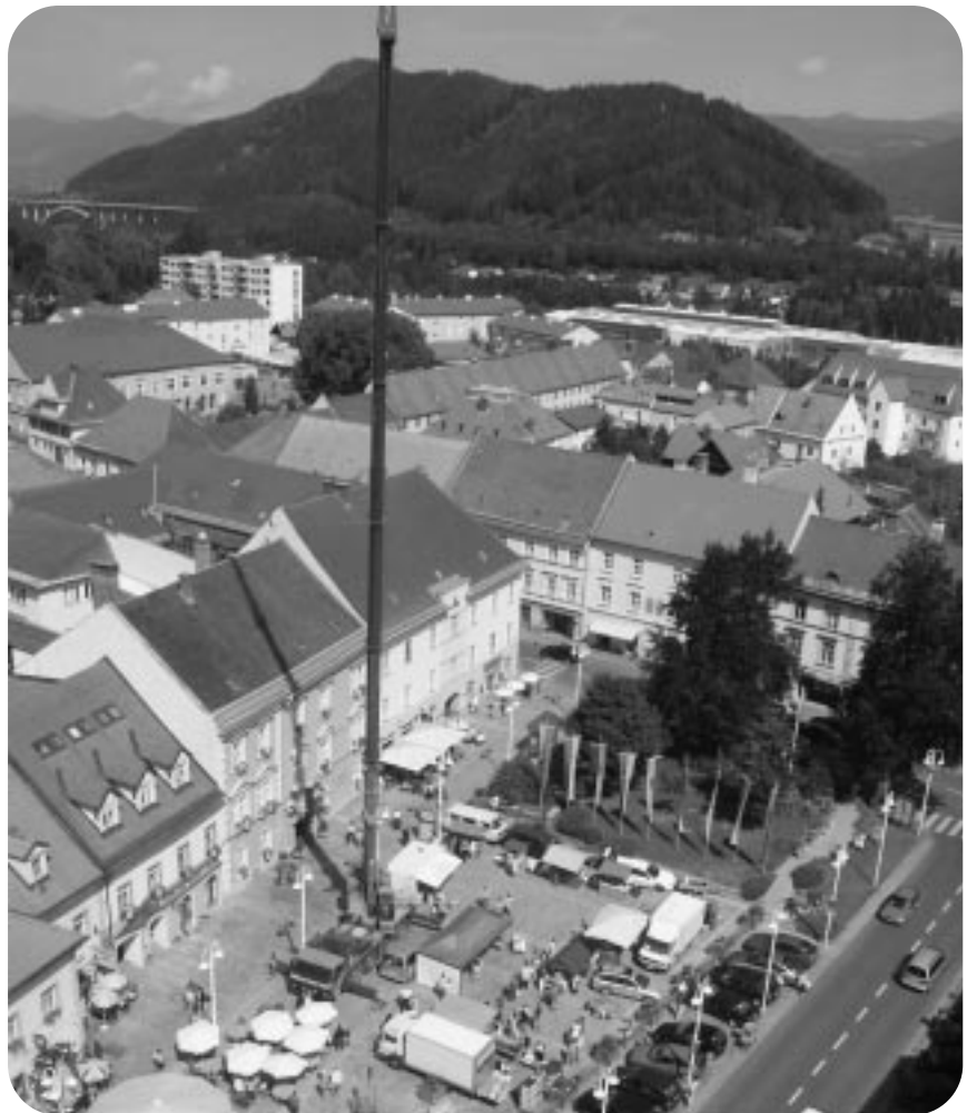
Der Hauptplatz von Judenburg mit dem 74 Meter-Kran.

Seit Mitte April ist die WEB Windenergie AG mit einem 20 % – Anteil Gesellschafterin der Tauernwind. Das bedeutet nicht nur einen neuen Standort für die WEB, sondern bringt auch die Möglichkeit zur Bürgerbeteiligung am