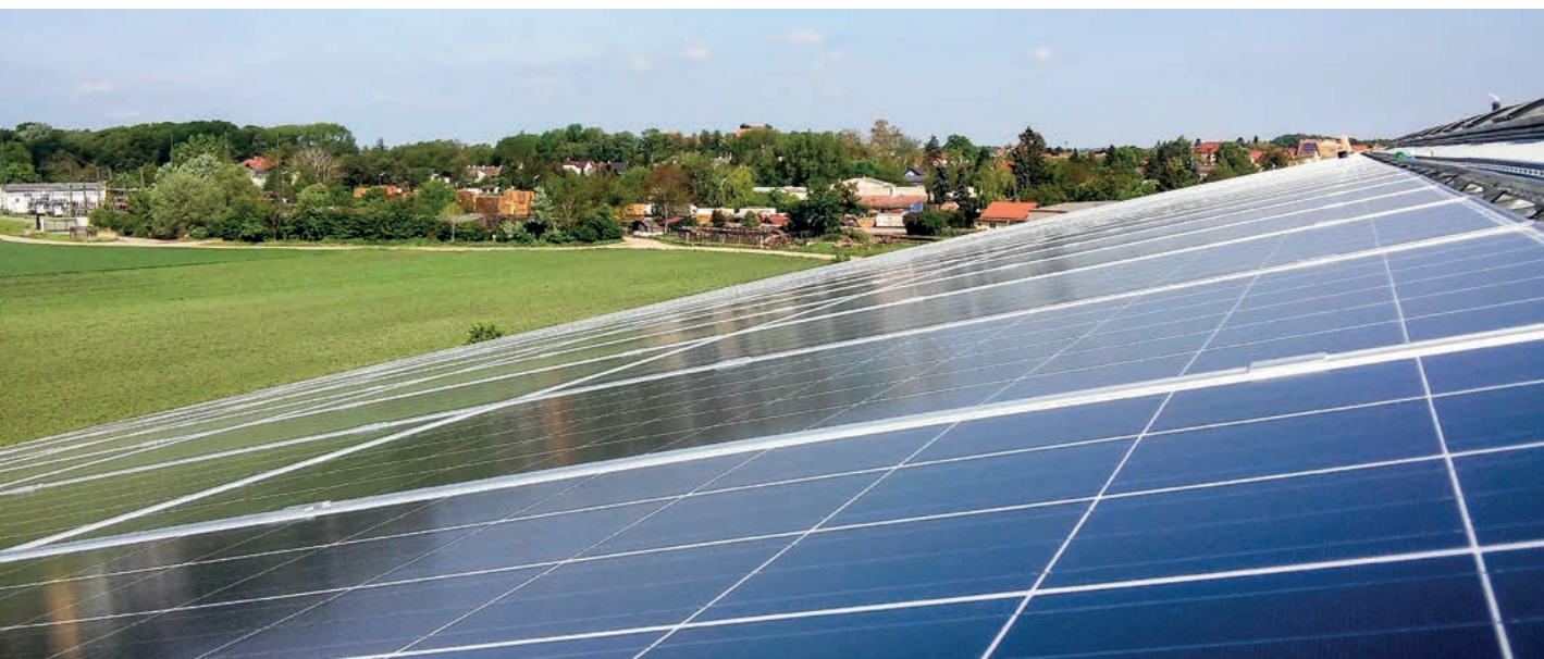
Die W.E.B setzt auch auf die Kraft der Sonne und installierte in Laa an der Thaya drei PV-Anlagen.