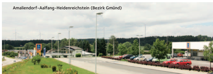
Amaliendorf-Aalfang-Heidenreichstein (Bezirk Gmünd)