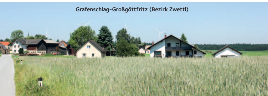
Grafenschlag-Großgöttfritz (Bezirk Zwettl)

So werden die geplanten Waldviertler Windparks zu sehen sein, wie sie die W.E.B-Projektierungsabteilung in ihren Fotomontagen einmontiert hat.