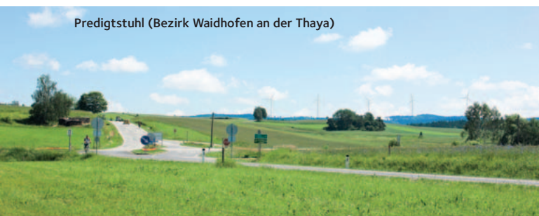
Predigtstuhl (Bezirk Waidhofen an der Thaya)