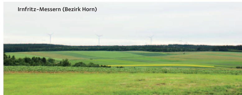
Irnfritz-Messern (Bezirk Horn)

Durch dieses Vorhaben werden in die Region bis zu 350 Mio. Euro investiert, die größte Investitionssumme die im Waldviertel je getätigt wurde. Bei der Errichtung der Windparks werden die ortsansässigen Unternehmen eher bevorzugt. So wird die Region wirtschaftlich gestärkt