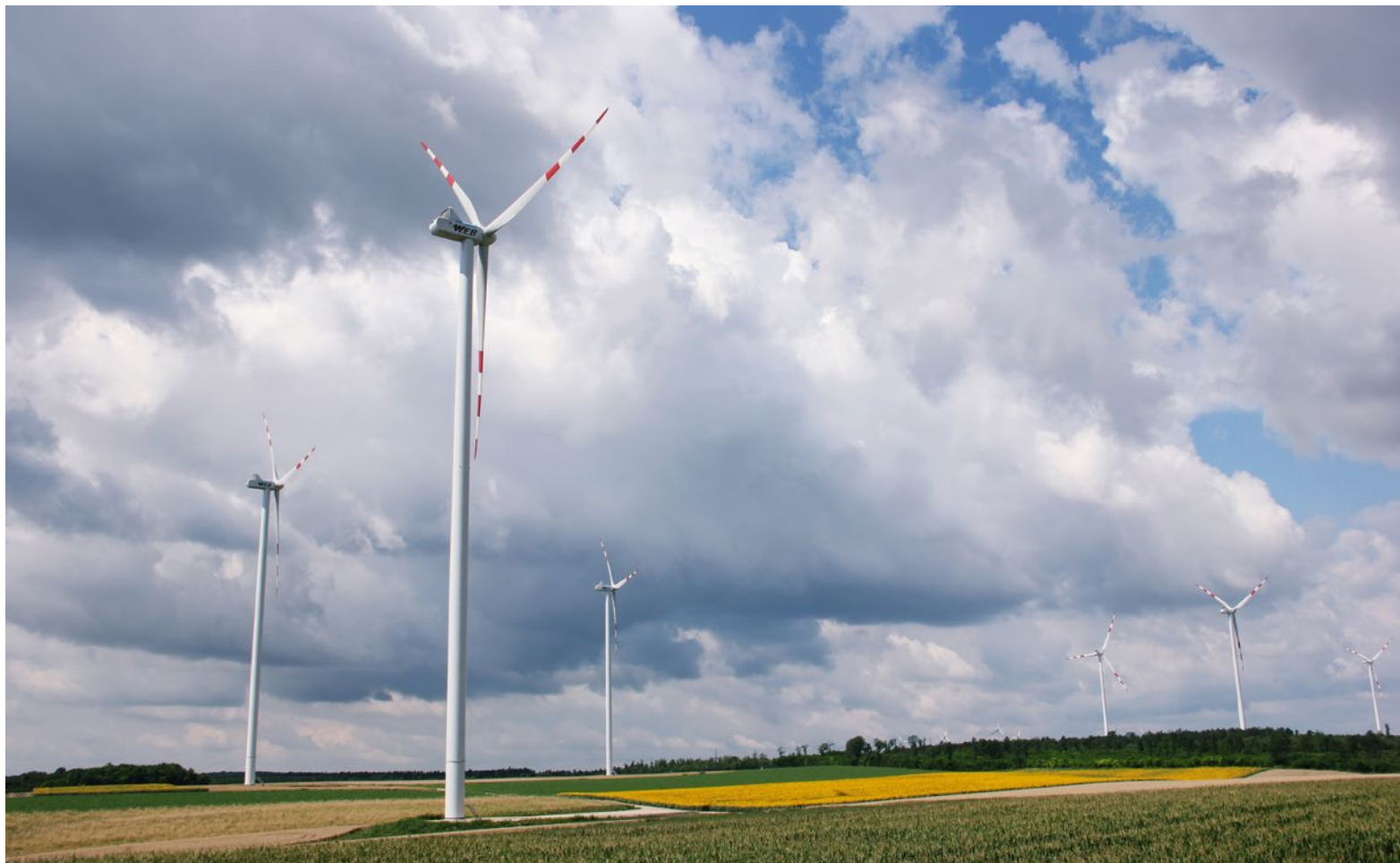
Spannberg setzt weiter auf Windenergie! Bei der Volksbefragung gab es ein klares Votum für neue Anlagen.

Die Partnergemeinde der W.E.B. beherbergt schon einige Windenergieanlagen der W.E.B. In Zukunft sind weitere Projekte geplant. Über eines davon wurde Anfang 2019 abgestimmt, und das Ergebnis zeigt: Die Spannberger stehen nach wie vor mit großer Mehrheit hinter der Windenergie.