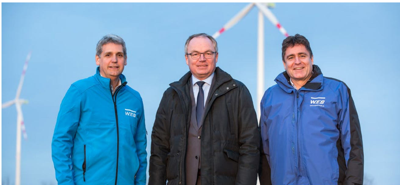
Landeshauptfrau-Stv. Stephan Pernkopf war bei der finalen Inbetriebnahme des Windparks Dürnkrot-Götzendorf II vor Ort.