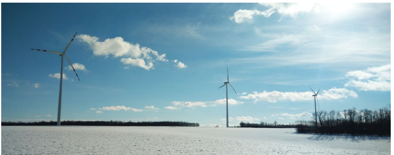
Dieser Schnappschuss der Winterlandschaft gelang im Windpark Maustrenk (Niederösterreich).