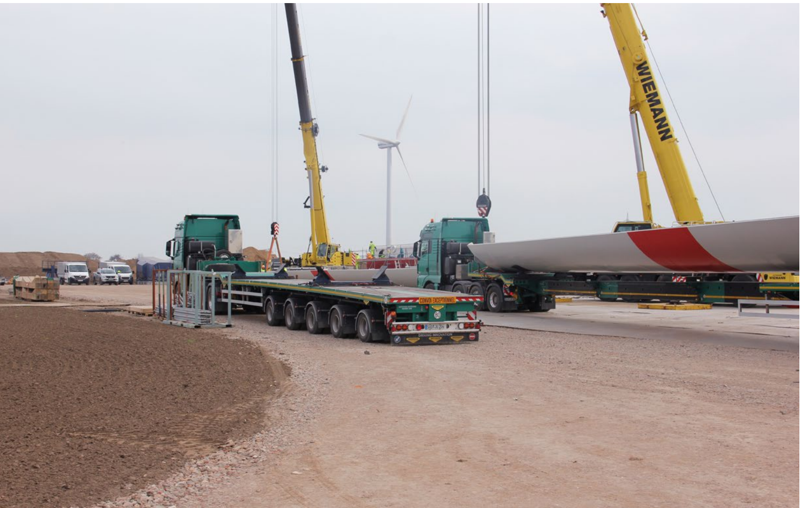
Die angelieferten Anlagenteile im Windpark Wörbzig wurden auf dem Boden bereits zusammengebaut. Schon bald folgt die Inbetriebnahme.

Nordamerika, Mittel- und Südeuropa – so sieht die aktuelle Baustellenlandkarte der W.E.B aus. Neuigkeiten gibt es aus vier Ländern, darunter sind neben Windparks natürlich auch PV-Projekte und die Sanierungsarbeiten eines Kleinwasserkraftwerks.