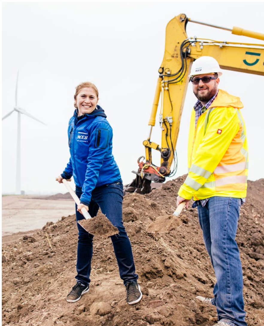
2018 feierte die W.E.B einige Spatenstiche – so auch beim Repoweringprojekt in Wörbzig.

Das vergangene Jahr war auch die Zeit der Spatenstiche und Premieren. In Deutschland starteten die Bauarbeiten für das Repoweringprojekt Wörbzig, in Piombino die Bauarbeiten für den ersten italienischen W.E.B-Windpark „Foce del Cornia“. In Kanada wagte die