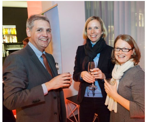
Bei den Kamingsgesprächen Anfang des Jahres hatten Investoren und Freunde der W.E.B wieder in gemütlicher Runde die Gelegenheit, mit dem W.E.B-Vorstand zu diskutieren.