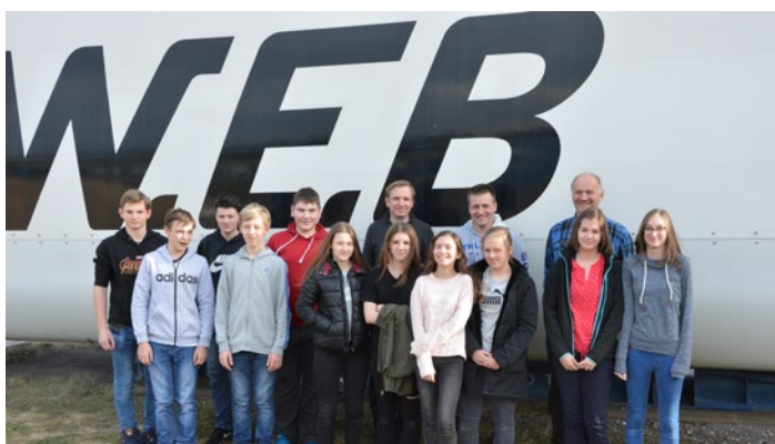
Im Dezember durfte die W.E.B Schüler des Gymnasium Waidhofen an der Thaya begrüßen.