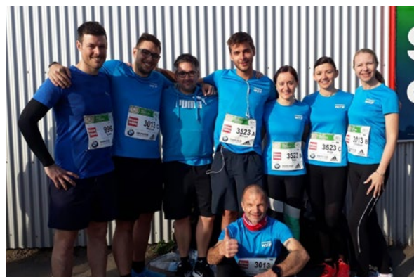
Running W.E.B! Gleich zwei Staffeln stellte die W.E.B beim diesjährigen Vienna City Marathon.