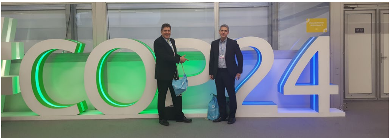
Ende 2018 war die W.E.B zu Gast auf der COP24 in Katowice (Polen) und kam mit einigen spannenden Eindrücke nach Hause.